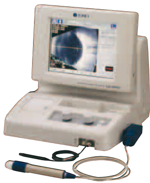
超音波画像診断装置